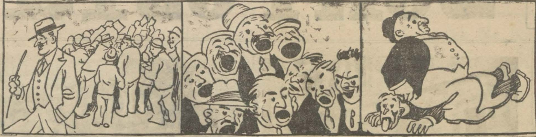
1 - Eger belediye intihabında "neme lâzım?" der, rey vermezseniz. 2 - İntihabat mücadelesinde sesinizi yükseltmezseniz. 3 - İstemediğiniz adamlar iş başına geçer ve sizi ezer.