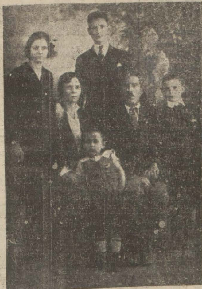
[Kazaya kurban giden kadın sandalyada, çocukları arasında] evkaf idaresine ter- hin ederek borç para almak istemektedir.

Dür, Sirkeci'de bedbaht bir ka- dının tramvay altında can ver- diğini yazmıştık. Bu biçarenin adı Bolisovadır. Mu- iz isminde bir zaten zevcesidir. dört tane çocuğu vardır.