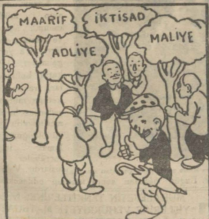
1: Hasan B. — Oyun başlıyor. Evvelâ Cemal Hüsnü B. ebe oldu.