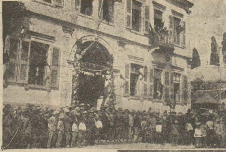
Sağdan yukarı: Bergama kurtuluş bayramı 14 Eylül hatırası..

Beycenin muhiti beş yüz kilometre murabbıdır. Har-