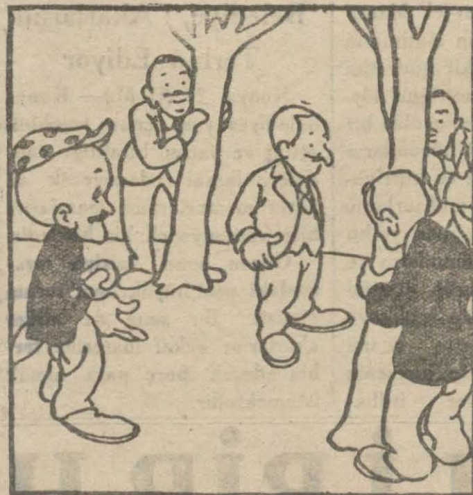
3: Hasan B. — Hoppala... Şimdi de Mahmut Esat B. ebe.